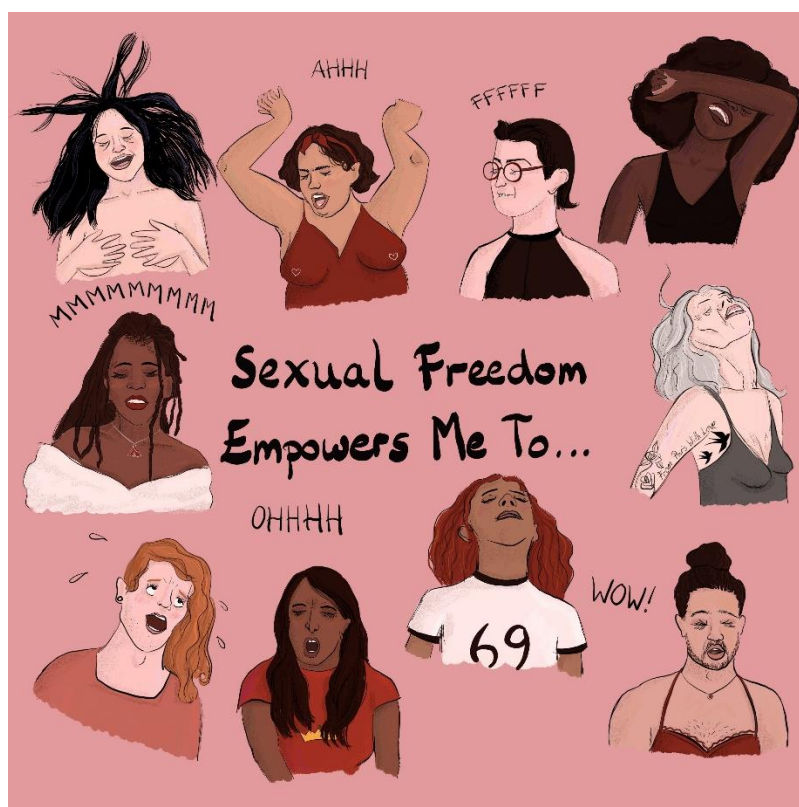
Ilustrace od @Hazel.Mead

práv žen. Tato ilustrace znázorňuje siluety žen z různých kultur a prostředí v okamžicích sebe-potěšení, což má podtrhnout důležitost toho, umět sám sobě říct ANO, uvolnit napětí a dát průchod emocím. Zároveň je tento obrázek spojený s dalším z cílů značky Satisfyer – „sexuální zdraví je pro každého bez ohledu na jeho pohlavní identitu, socioekonomické prostředí, věk nebo pohlaví“.