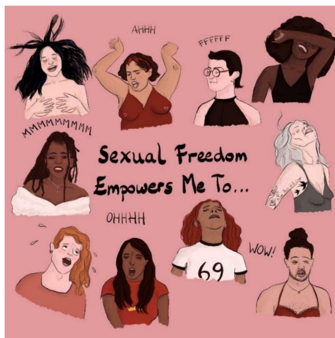
Ilustración de la campaña de @Hazel.Mead

La dinámica del reto será la siguiente: bajo el hashtag #ChooseToChallenge (“atrévete a retarte”), se animará a todo aquel que lo desee a participar y aportar su opinión y sus reflexiones con el fin de convertirse en una declaración de la libertad sexual femenina. Todas las aportaciones darán voz a la frase “La libertad sexual me empodera para...” y, además de publicarse en el perfil de Instagram de Satisfyer, se podrán encontrar en una página web “ Safe Space ” (espacio seguro) creada específicamente para la acción y que incluirá también contenido educativo y, sobre todo, empoderador.